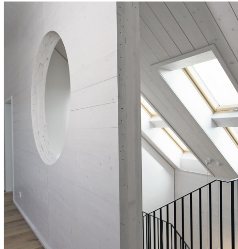
Es ist die Liebe zum Detail, die außen wie auch innen auffällt.