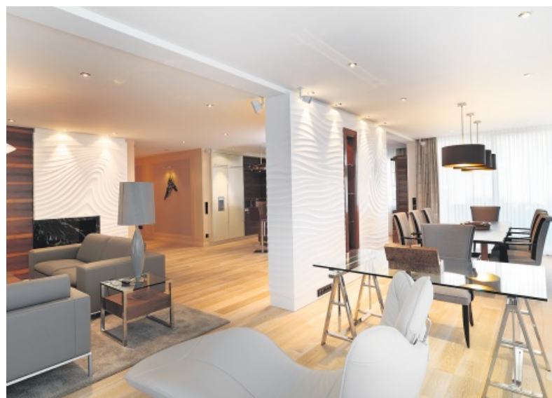
Kasper & Neiningen steht für Interieur auf höchstem Niveau.