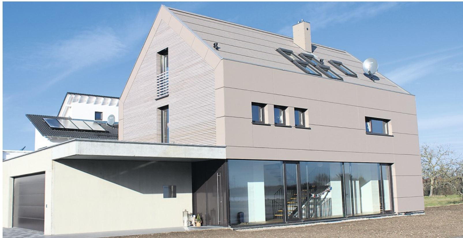
Traditionelle Massivholzbauweise und Anspruch in Architektur sind kein Widerspruch, wie Kasper &amp; Neiningen unter Beweis stellen.