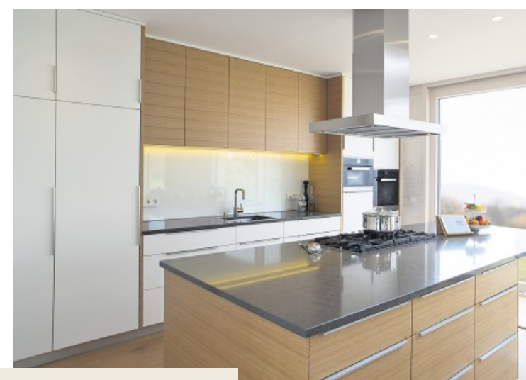
Ausgefeilte Haustechnik, auch in der Küche, erleichtert den Alltag.

Denn obwohl die massiven Holzhäuser äußerst robust sind, geben sie dem Bewohner jedes gewünschte Maß an Gestaltungsflexibilität. Die Kombination aus widerstandsfähigen und pflegeleichten Faserzementplatten machen den natürlichen Werkstoff Holz zu einem sehr flexiblen Baumaterial, dem man seinen Kern nicht anzusehen braucht. Im Gegenteil: Der altbewährte Werkstoff lässt sich mit moderner Innenarchitektur durchaus vereinen. Kontrastierende Materialien und eine offene, warme