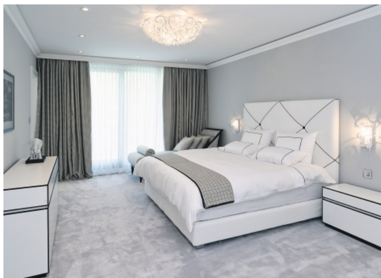
Ausgesuchte Lieferanten gewährleisten die hohe Qualität.