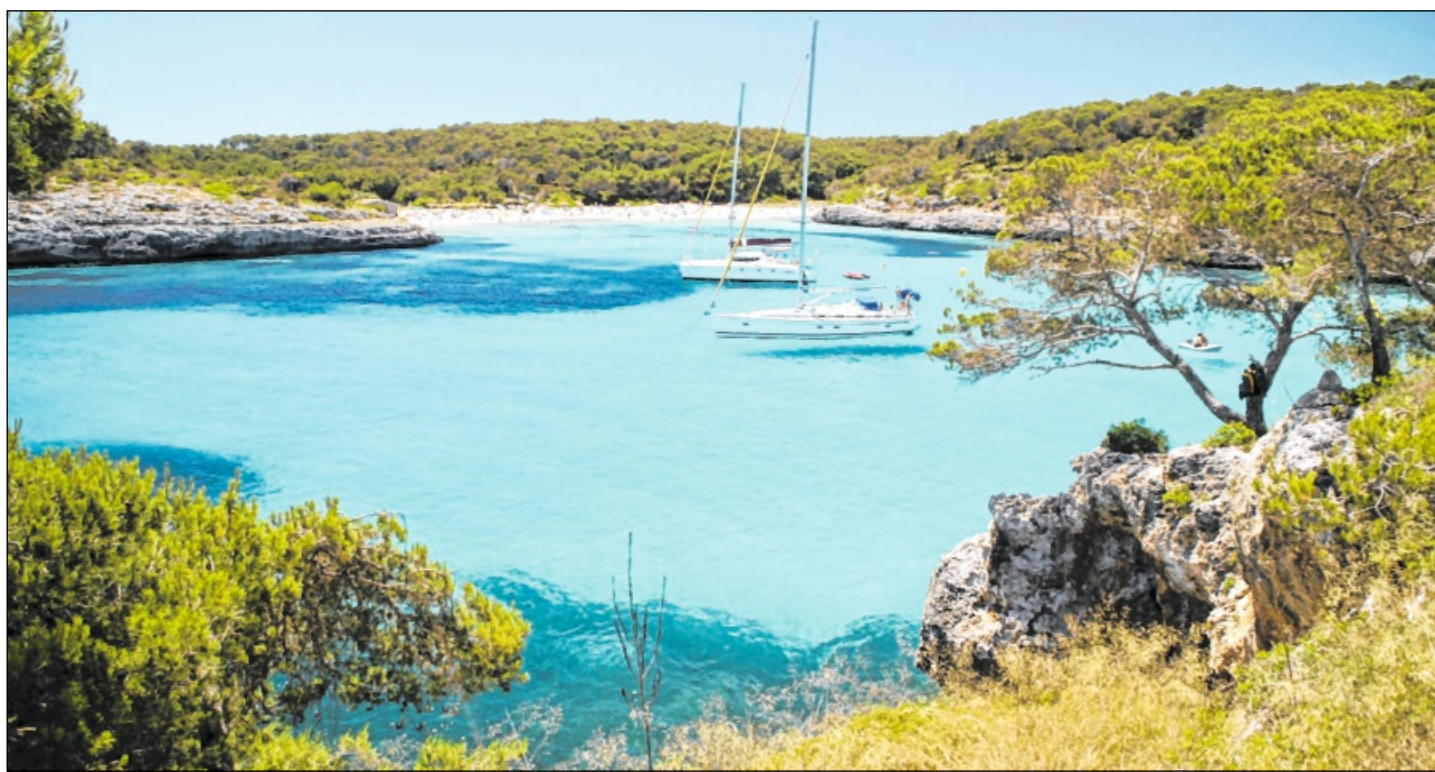
DES DEUTSCHEN LIEBLINGSINSEL IM AUSLAND: Mallorca bleibt, wie die Balearen insgesamt, gefragt. Das Bild zeigt die Cala Mondrago im Südosten Mallorcas. Spanien-Reisen sind beim DER Touristik-Konzern etwas teurer geworden.

Die Verunsicherung der Kundschaft zeigt sich auch bei den Reisezielen: Urlaub im eigenen Land war zwar schon immer sehr gefragt, doch liegen die Deutschland-Buchungen derzeit noch einmal um 28 Prozent höher als vor einem Jahr. Nord- und Ostseeküste,