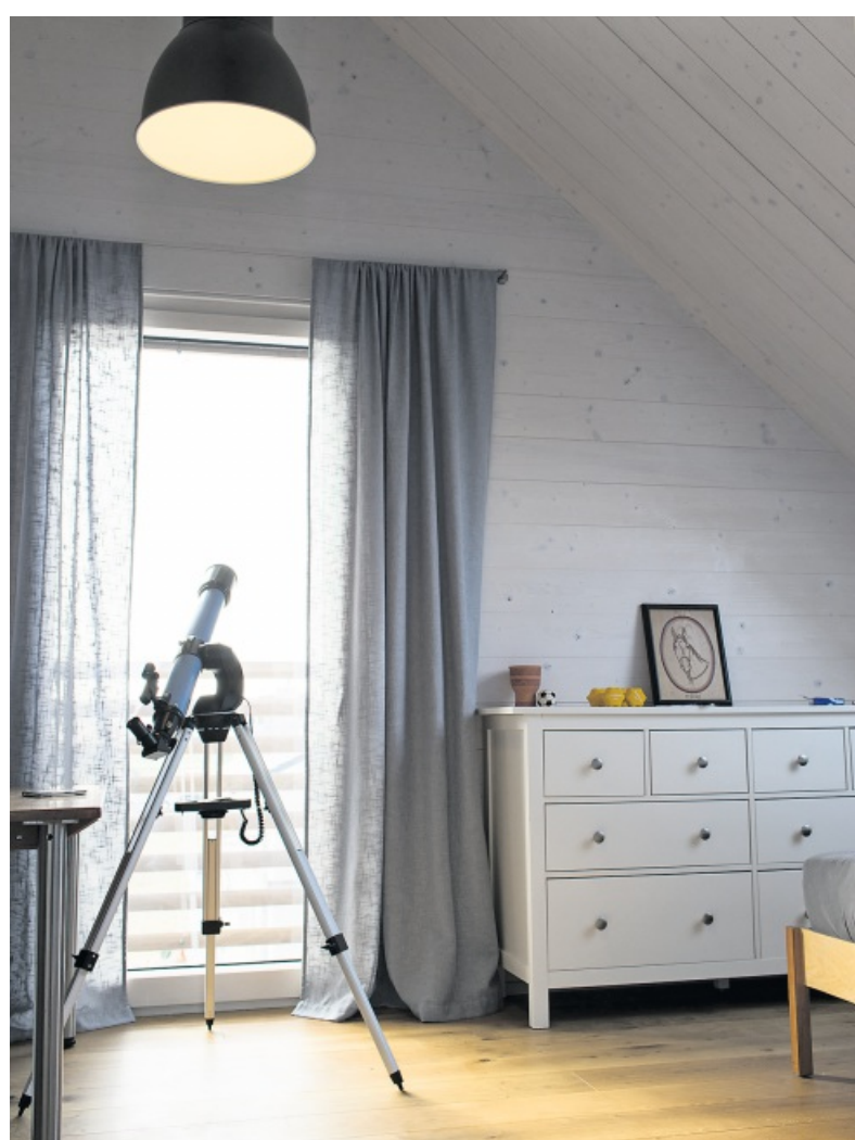
Hoher Komfort und Wohlfühlfaktor zeichnen das Gebäude aus.

sowie lebendige Atmosphäre in Verbindung mit sorgsamer Verarbeitung, Technik auf dem neuesten Stand und Design mit Niveau lassen bei anspruchsvollen Bewohnern keine Wünsche offen. Dazu kommt: Alle